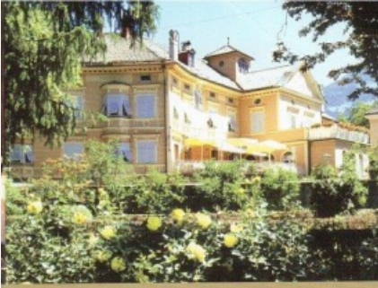
Führende Gastlichkeit seit 450 Jahren